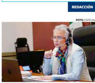
MANO FIRME • Sánchez Cordero busca igualdad de género en todos los niveles.

• SEGOB IMPULSÓ DECRETO QUE CONTIENE ACCIONES PUNTUALES PARA GARANTIZAR LOS DERECHOS Y DISMINUIR LA VIOLENCIA CONTRA MUJERES